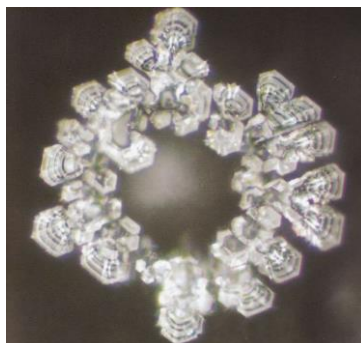
Wasserkristall vom Wasserfall

Das nachfolgende Beispiel zeigt den Unterschied von ionisiertem Wasser von einem Wasserfall und Leitungswasser im Bergell.