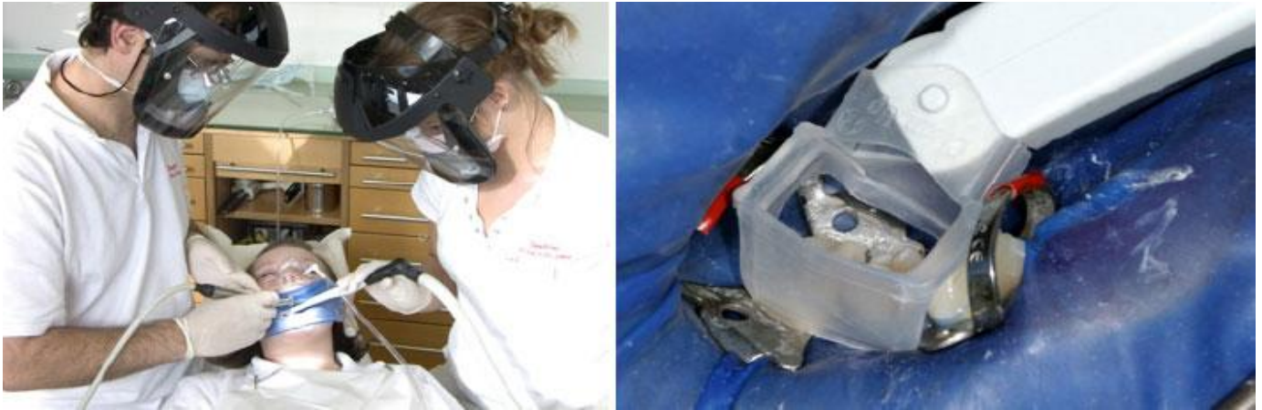
Bild: Amalgamentfernung Zahnärztliche Tagesklinik Konstanz.